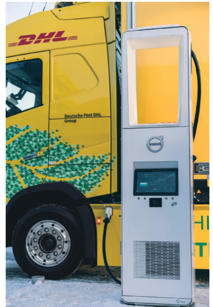
全球最大的郵遞與物流集團DHL也購入44輛FM Electric，包含電動曳引車、底盤車與貨車等不同車款，預計在2023年會全數交付完成。