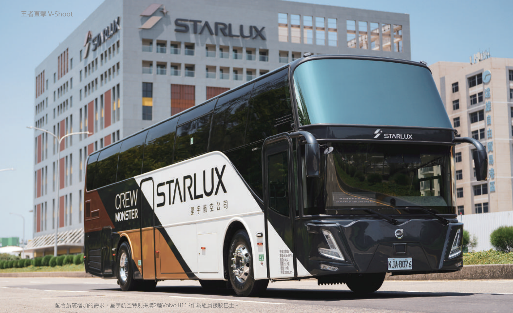
配合航班增加的需求，星宇航空特別採購2輛Volvo B11R作為組員接駁巴士。