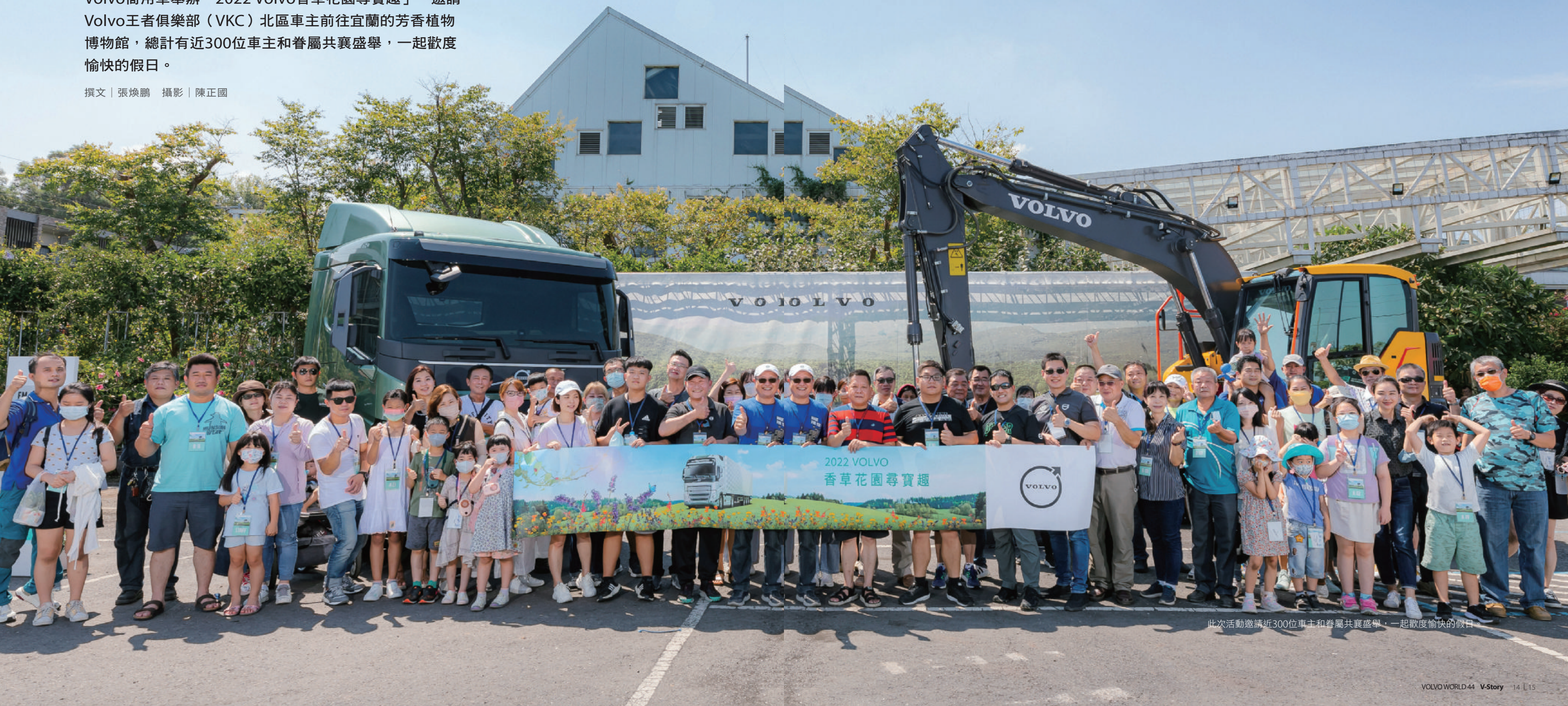
此次活動邀請近300位車主和眷屬共襄盛舉，一起歡度愉快的假日。

陽光普照的星期天，正是出遊的好日子。7月24日上午10點，來自雙北、桃園、新竹等地的車主，帶著他們的家人陸續抵達「香草菲菲」，Volvo商用車的工作團隊在入口處熱情迎接貴客到訪，親切指引車主們就定位。活動現場還展示一台ECR145EL挖掘機以及一台FM 42T 460歐六卡車，沉穩又頗具氣勢的外型緊緊抓住了眾人目光。