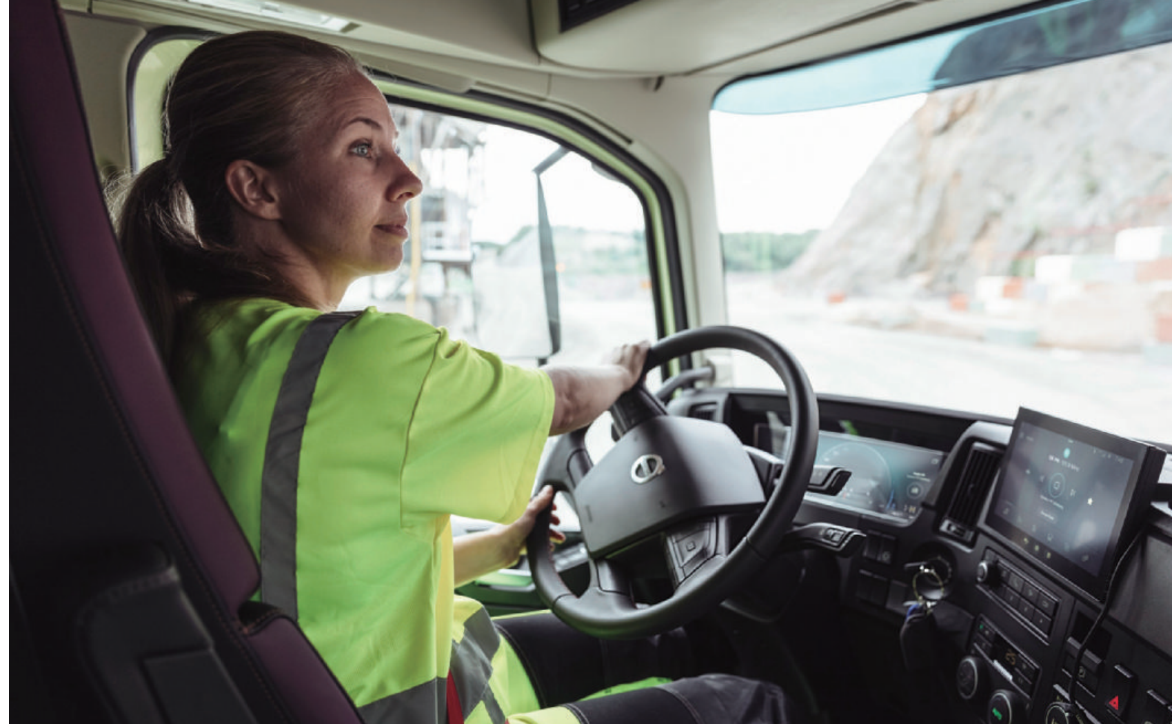
隨著女力崛起，愈來愈多女性跳脫性別角色的框架，開拓更多職涯發展的可能性。

由太古商用汽車打造的「IRON LADY 女力重卡巴士駕訓學院」與雄獅集團密切合作，聯手打造更優質的女性求職管道與平台，為台灣運輸前景盡分心力。這項培訓計畫第一階段課程將於今年開跑，學費由太古