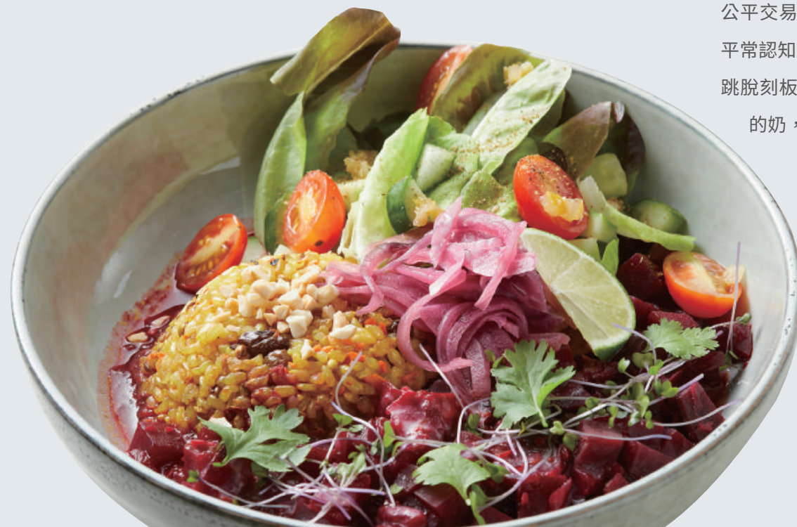
「甜菜根咖哩風味飯」選用自帶獨特香氣的台中194糙米，與各式香料互相襯托，並搭配來自嘉義、屏東、南投等地的食材。

還有一款完全征服我味蕾的「南洋裸食捲」，餅皮裡面包捲的全是當令的時蔬與水果，加點微辣的南洋風味堅果抹醬更對味。但是最令我驚豔的外皮的主要食材居然是木瓜，真的完全顛覆想像，但是吃起來又