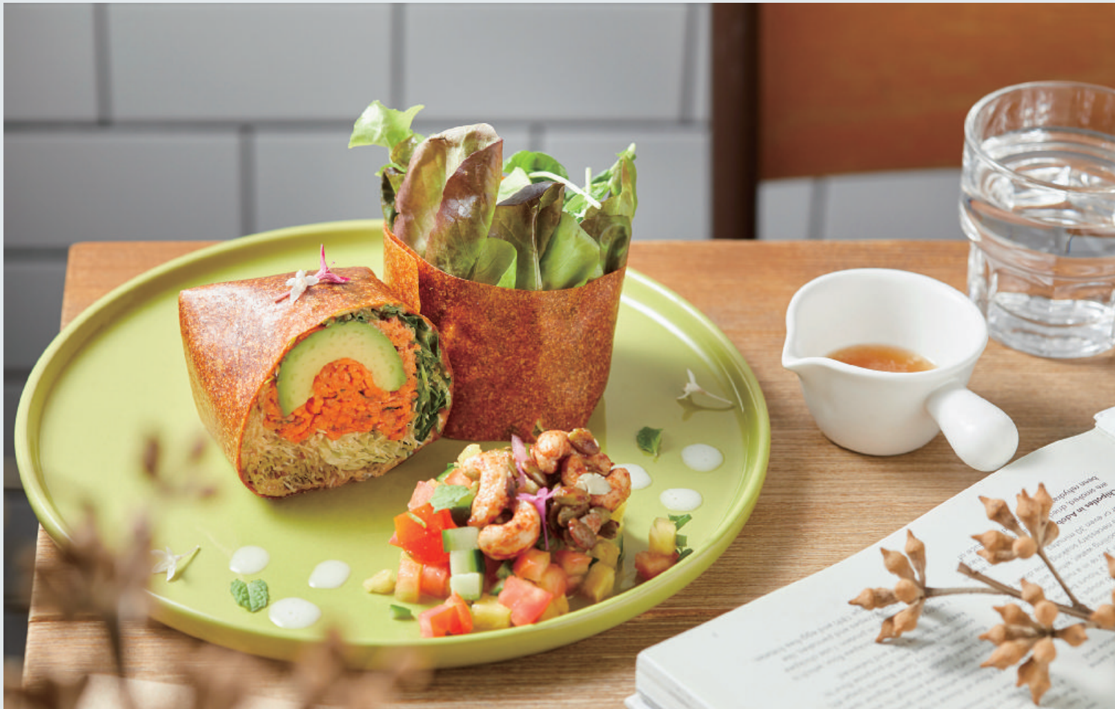
「南洋裸食捲」外皮以木瓜作為主要食材，裡面包捲當令的時蔬與水果，味道豐富有層次。