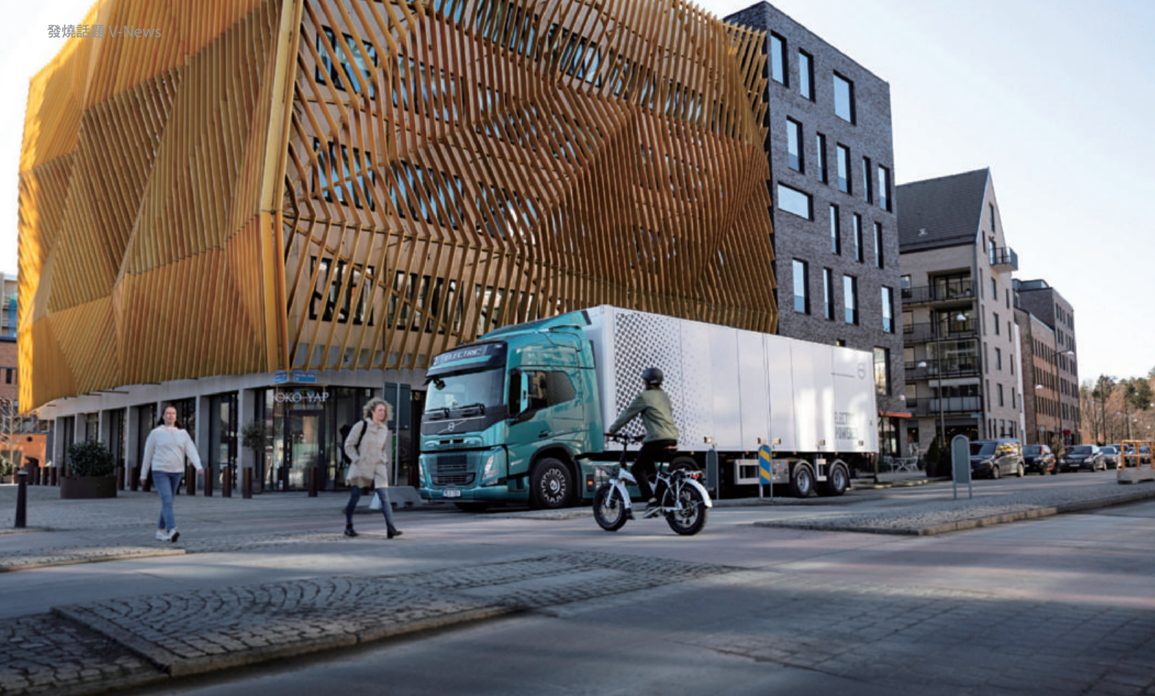
Volvo Trucks針對電動卡車的發展規劃三個階段，其中第二階段的「提升應用期」，主要用於市區為主的物流配送、垃圾清運等固定路線的使用。

從保養維修層面切入，因車輛運轉時震動大幅減少，本身零件壽命也可有效提升，與傳統柴油動力車款相較，根據統計，保養費用可足足減少30%之多，能源消耗成本更減少高達80%，雖然當前電動卡車購置成本仍較傳統柴油車款高上許多，但著眼近年來電池成本的持續下降，相信電動卡車的優勢會愈加明顯。