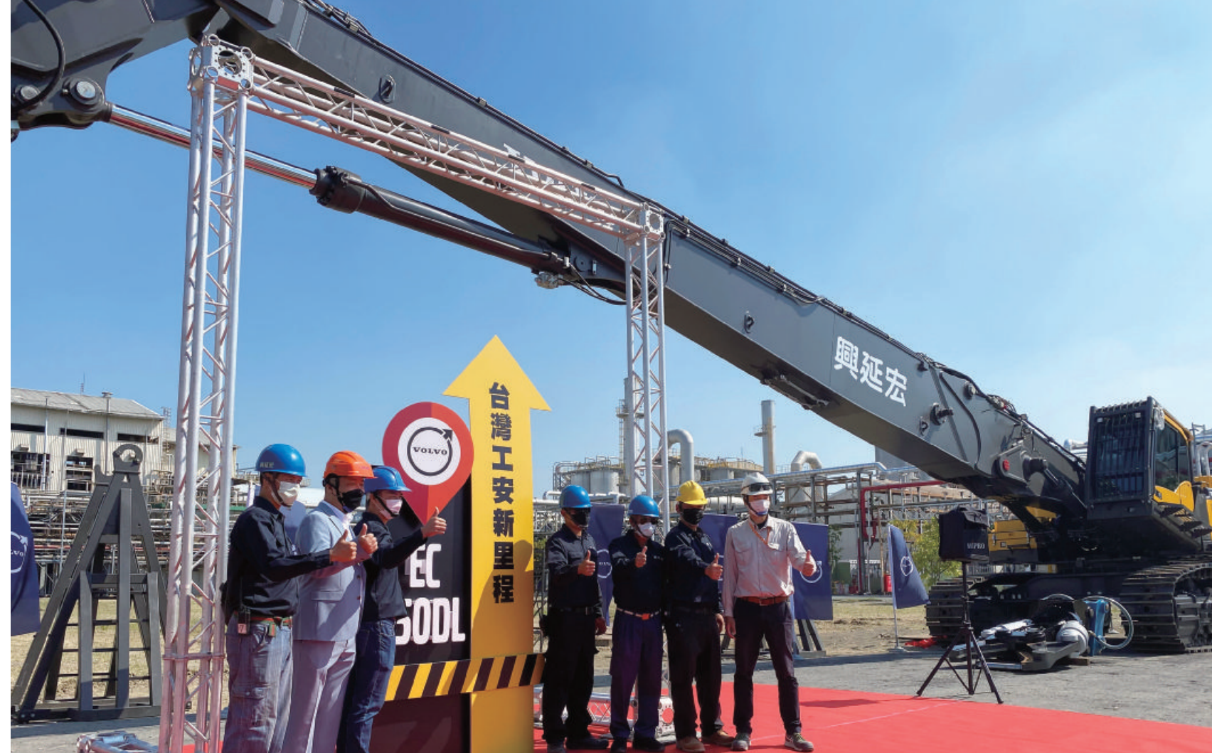
興延宏公司同步購入Volvo EC750DL拆除機與EC380DL大型履帶式挖掘機，打造台灣工安新標準。

憑藉著Volvo CE與太古團隊的攜手合作，自2021年太古商用汽車接手以來，已有多間交機客戶，其中位於高雄的興延宏公司同步購入了Volvo EC750DL拆除機與EC380DL大型履帶式挖掘機。擁有高達33公尺全台最高規格的EC750DL拆除機的引進，更是三方合作的最佳典範。日前受到奇美實業拆除舊廠房工程的委託，擁有豐富中油舊油槽拆除經驗的興延宏公司接下任務後，首先評估奇美實業舊廠房21公尺的高度，既有機具最高高度僅18公尺，以及奇美實業對於工程安全的極高注重，透過太古商用汽車的努力，首度引進全台首台EC750DL拆除機，透過EC750DL拆除機的努力，完美的達成任務。奇美實業、興延宏公司與太