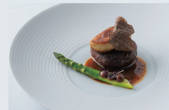
由「羅西尼牛排」延伸想法的「羅西尼」，以肥厚的波特菇取代牛排，經過不同食材風味堆疊，呈現出豐富口感也帶出深厚的香氣。

其中最令人驚豔的一道菜要算是由羅西尼牛排延伸想法的「羅西尼」，以肥厚的波特菇取代牛排，選用它肥嫩多汁的特性，鑲在其中的是洋菇、牛肝菌、香菇等各款蕈菇泥，而醬汁則是以洋菇與黑松露碎熬煮兩小時而成的，再搭配以雜糧麵包重組塑型，並加入葵花籽、芝麻等多種雜糧，完全取代鴨肝的角色，呈現出豐富口感也帶出深厚的香氣。