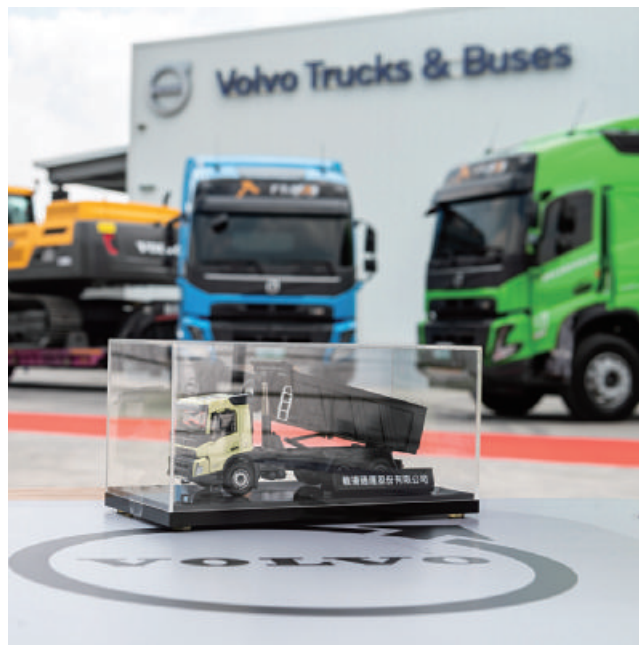
Volvo Trucks的手自排系統，換檔順暢，敏揚的蘇董表示舒適程度已經跟開轎車一樣、甚至比很多轎車更好，這成為他選擇Volvo Trucks的原因之一。

強大產品跟維修服務，我能跟客人的拍胸保證，是因為我不用擔心後勤出包。就像這次，我訂了兩台FMX，我為什麼試都不用試就直接一次訂兩台？因為我對Volvo、還有太古汽車的服務太有信心了啊！而且反而是我要感謝太古汽車，因為之前一直沒有進口這個產品，應該是因為這種等級的車，市場不大、油耗比較高，但它設計就是要載百噸以上的，剛好符合我的需求，我接著還要再訂！」