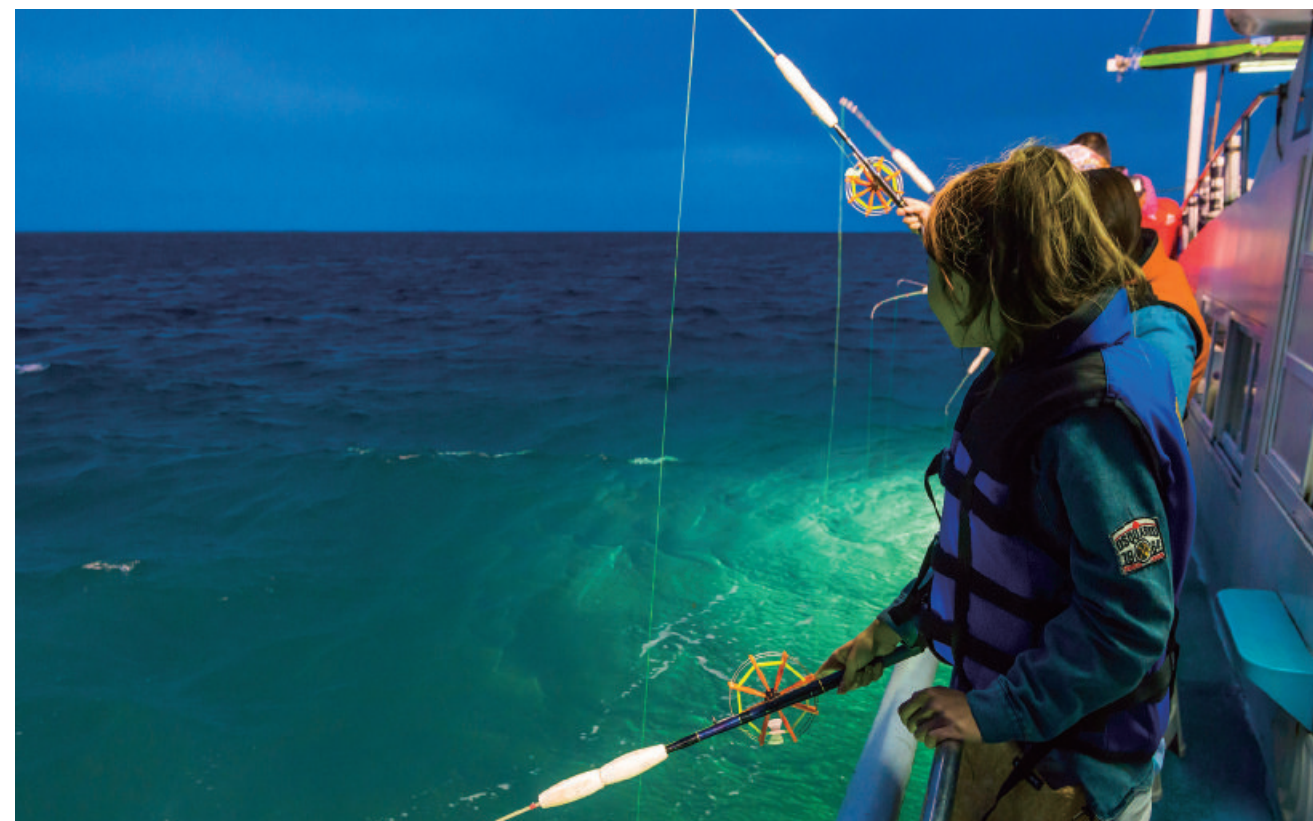
每年4月到10月，是澎湖小管量產的季節，船家點亮一盞盞的漁火燈吸引小管靠近，後來發展成休閒觀光，成為澎湖的招牌海上活動。

飽餐一頓後，第二回合再戰，有機會釣到迴游趨光性的軟絲、花枝，除了當場享用之外，還能冷凍宅配到家。電影、電視節目裡，乘風破浪與海洋的決鬥，在澎湖完美實現，沒有經驗的初學者也能等到小管上鉤，變身天才小釣手！整趟行程不只體驗海釣的驚喜，也能享用親自釣上的漁獲料理，海上樂活饗宴徹底滿足身心。