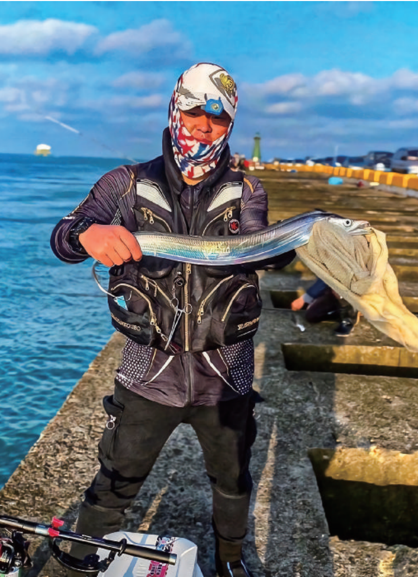
台中港附近的魚種豐富，被許多釣友譽為「釣魚天堂」。