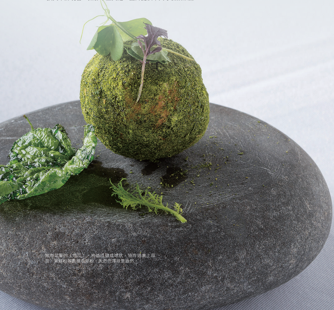
無肉菜單的「地瓜」，將地瓜做成球狀，油炸過裹上蒜苗、紫蘇粉等數種香草粉，天然色澤綠意盎然。