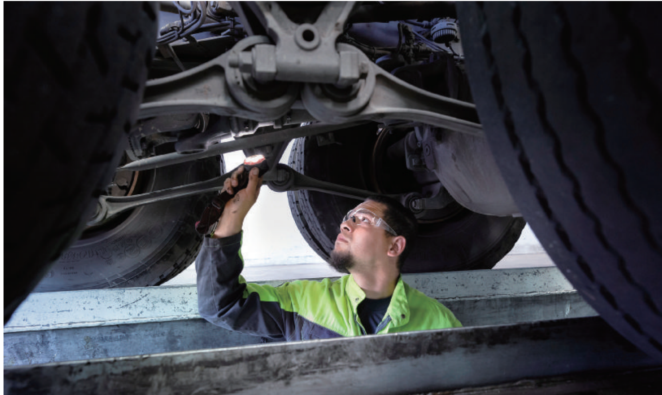
因為Volvo Trucks服務網絡完整，全台都有維修服務的據點，成為敏揚重要的後勤支援。