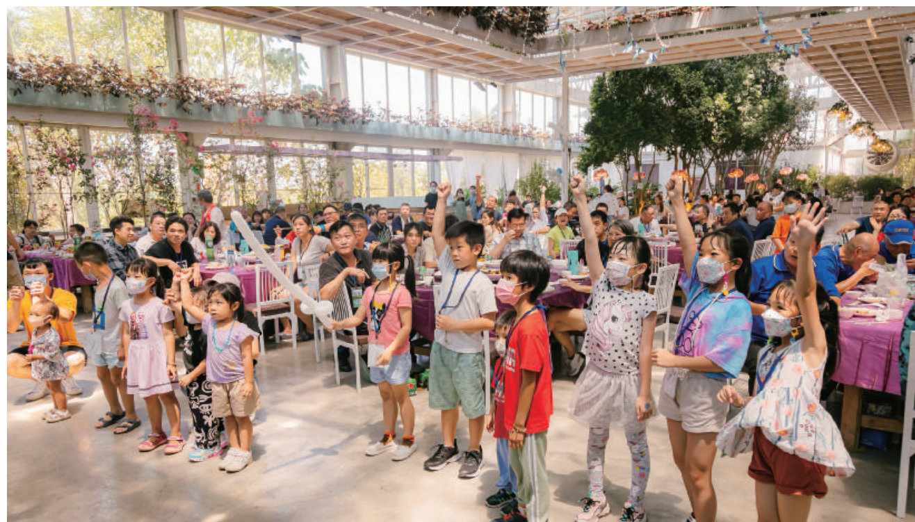
玻璃屋內，享用美味的同時，還有紅鼻子馬戲團帶來趣味演出，並與孩子們進行歡樂互動。

「VKC家庭日能夠讓凝聚車主之間的向心力，是非常不錯的活動。」中保物流相當重視員工的感受，除了提供安全、舒適的工作環境之外，每個星期天都固定讓員工休假，讓他們可以陪伴家人。此次特別帶著公司員工和家人來到宜蘭，他認為車主日能夠讓車主帶著家人到戶外放鬆身心，增進親子之間的感情，車主與車主之間也可以相互認識交流，是非常正向且具有意義的活動。身心、增進親子感情，車主之間也可以相互認識交流，是非常正向且具有意義的活動。