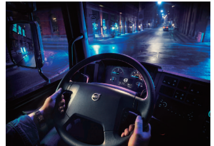
電動卡車在動力系統震動方面幾乎完全消弭，減少車輛運行噪音對於其他民眾或用路人所造成的影響。

自2019年開始推出電動卡車以來，Volvo Trucks已積極朝向全電氣化的未來大步邁進，期望能在2030年達成電動卡車銷售占比五成、2040年全面銷售電氣化車款的目標。而以台灣發展而言，透過太古商用汽車的努力下，電動卡車勢必也將在不久的將來在各道路上開始運行，Volvo Trucks所目標的電氣化未來，已經悄悄於當日實現！