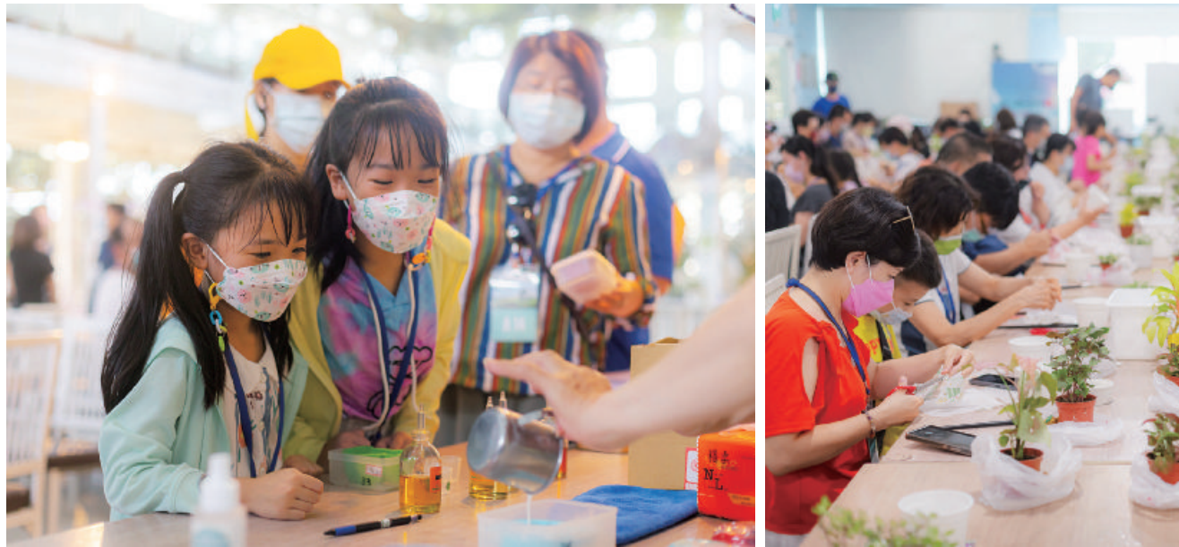
此次活動希望藉由輕鬆玩樂的過程中，達到寓教於樂的目的。