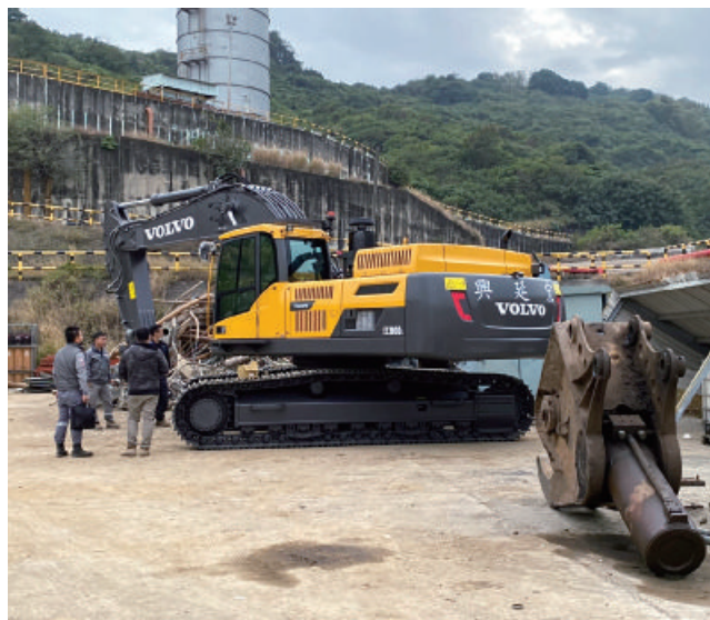
自2021年正式取得Volvo CE台灣代理權，已有多間交機客戶，如威武企業有限公司、滙實企業有限公司以及興延宏有限公司（由上至下）。

有服務據點，提供最佳的服務便利性與服務品質。尤其面對瞬息萬變的工程現場，太古商用汽車的團隊擁有最佳的協調力與應變能力，讓所有的工程皆可在安全、效率、完善的三大前提下圓滿成功。