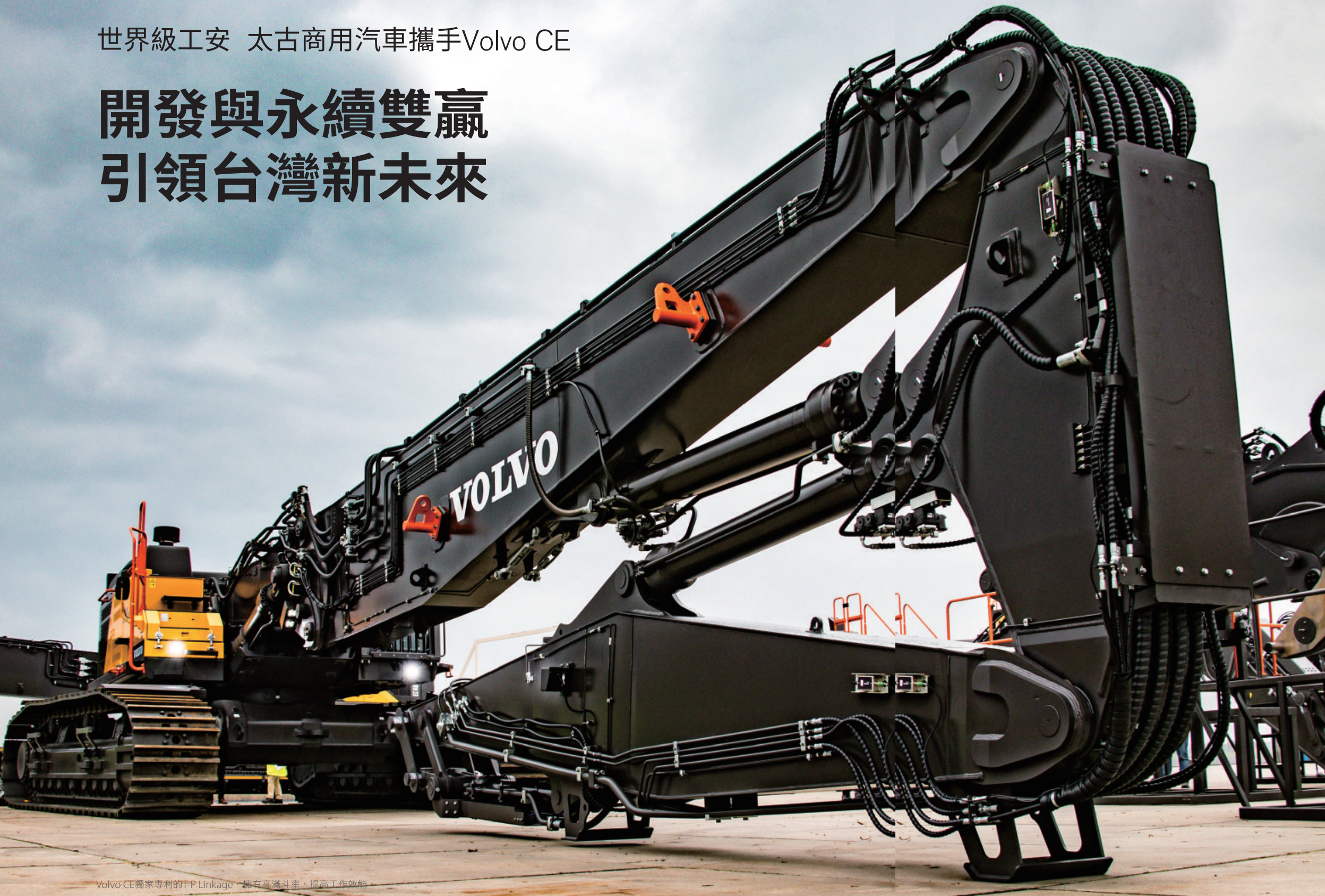
Volvo CE獨家專利的T-P Linkage，擁有高滿斗率，提高工作效能

延續Volvo Trucks and Buses與太古商用汽車超過40年的合作情誼，全球知名建築設備公司Volvo Construction Equipment也於2021年，由太古商用汽車肩負起在台經營業務，奠基於過往太古商用汽車一致好評的營銷與售後維修服務，勢必將成為工程機械、重型機械領域業主最值得倚賴的強力後盾，更將為台灣的工程安全創造全新高度。