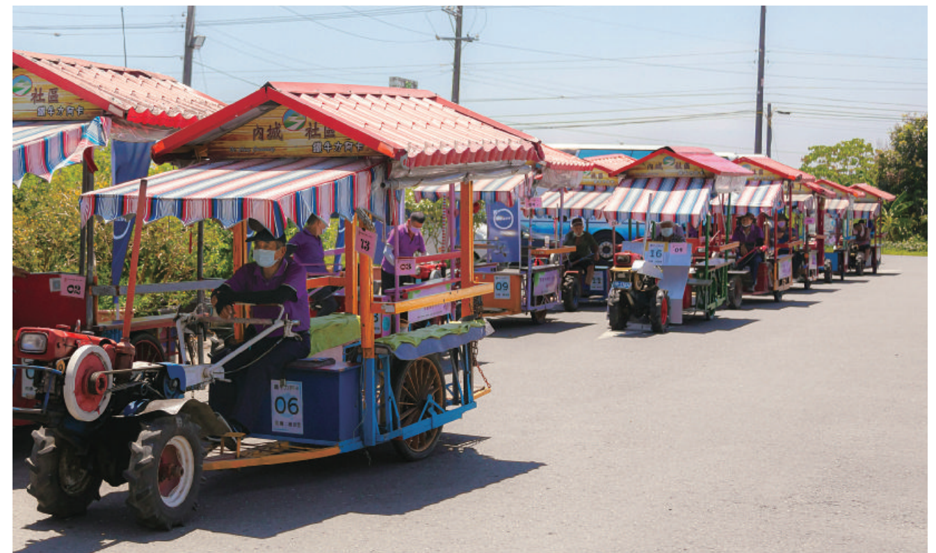
車主們搭乘「鐵牛力阿卡」前往蔥田，進行採採宜蘭蔥體驗。

鐵牛力阿卡車隊緩慢行駛在鄉間小路上，不一會兒就抵達附近的蔥田。內城社區的蔥田的水源來自雪山山脈，水質好、土壤肥沃，所以種出來宜蘭蔥品質極佳。蔥白長、葉肉厚、不嗆辣還帶著甜味，就是宜蘭蔥的特色。對於大多數的車主來說，搭乘鐵牛力阿卡和採蔥，都是前所未有的體驗，大家都充滿著期待。「拔蔥的時候，雙手握住蔥白，然後稍微晃動一下讓根部的土壤鬆動，接著出力往上拔。」蔥農站在一旁告訴大家拔蔥的技巧。許多小朋友都是第一次踏入蔥田，興奮之情溢於言表，拔蔥體驗結束後，人手一把新鮮的宜蘭蔥，滿足地離開蔥田。