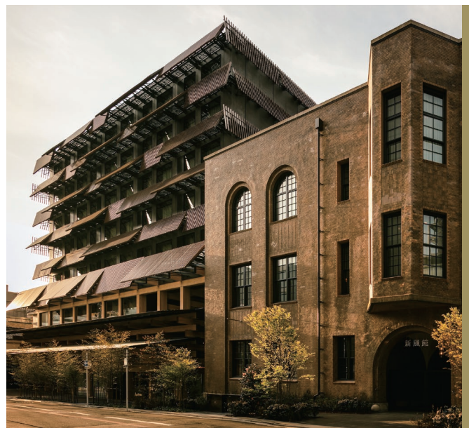
· 現代建築的極簡之美，經過近百年依然洗鍊

通過以上方式，將建築、土地和歷史連為一體，新風館與Ace Hotel，讓旅人走訪的時候，得以感受不同世代巧妙結合的歷練之美。