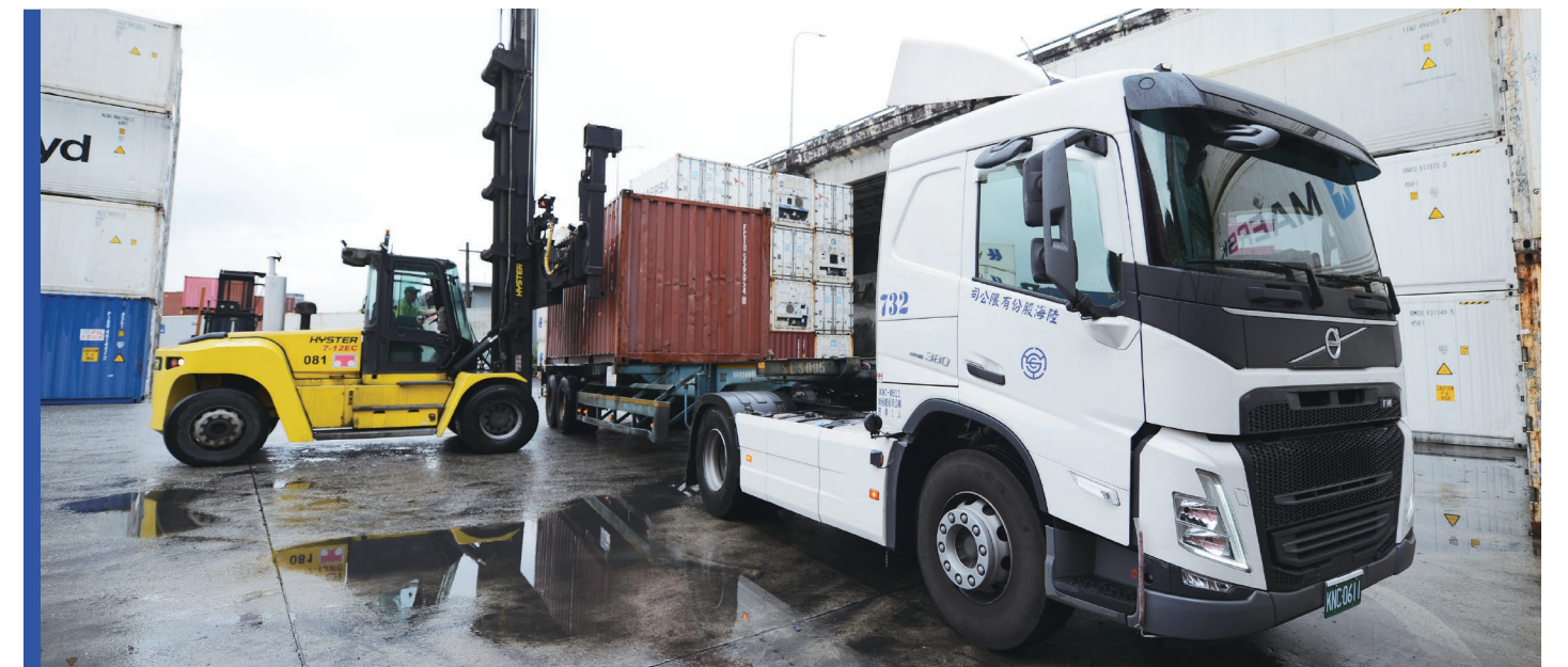
· 每個貨櫃的運送 陸海都嚴陣以待

當其他公司把核心競爭力設定，還游移在到底該「用戶導向」抑或「產品導向」時，何董很堅定的選擇了「員工導向」作為陸海永續發展的起手式。而這個起手式，奠定了陸海繁榮50年的璀璨與恆遠，這讓我想起了另一句馬拉松名言：人生是一場馬拉松，而不是百米衝刺。