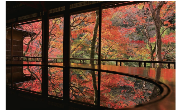
· 倒映在水池中的楓紅，形成絕色 @junichiro.takikawa

無庸置疑，京都是一個充滿藝術和文化魅力的地方，無論您是藝術愛好者、喜愛大自然還是熱愛探索文化，都可以在這裡找到屬於自己的寶藏。讓我們一同前往這個永遠看不膩的城市，開啟專屬自己的獨特旅程。