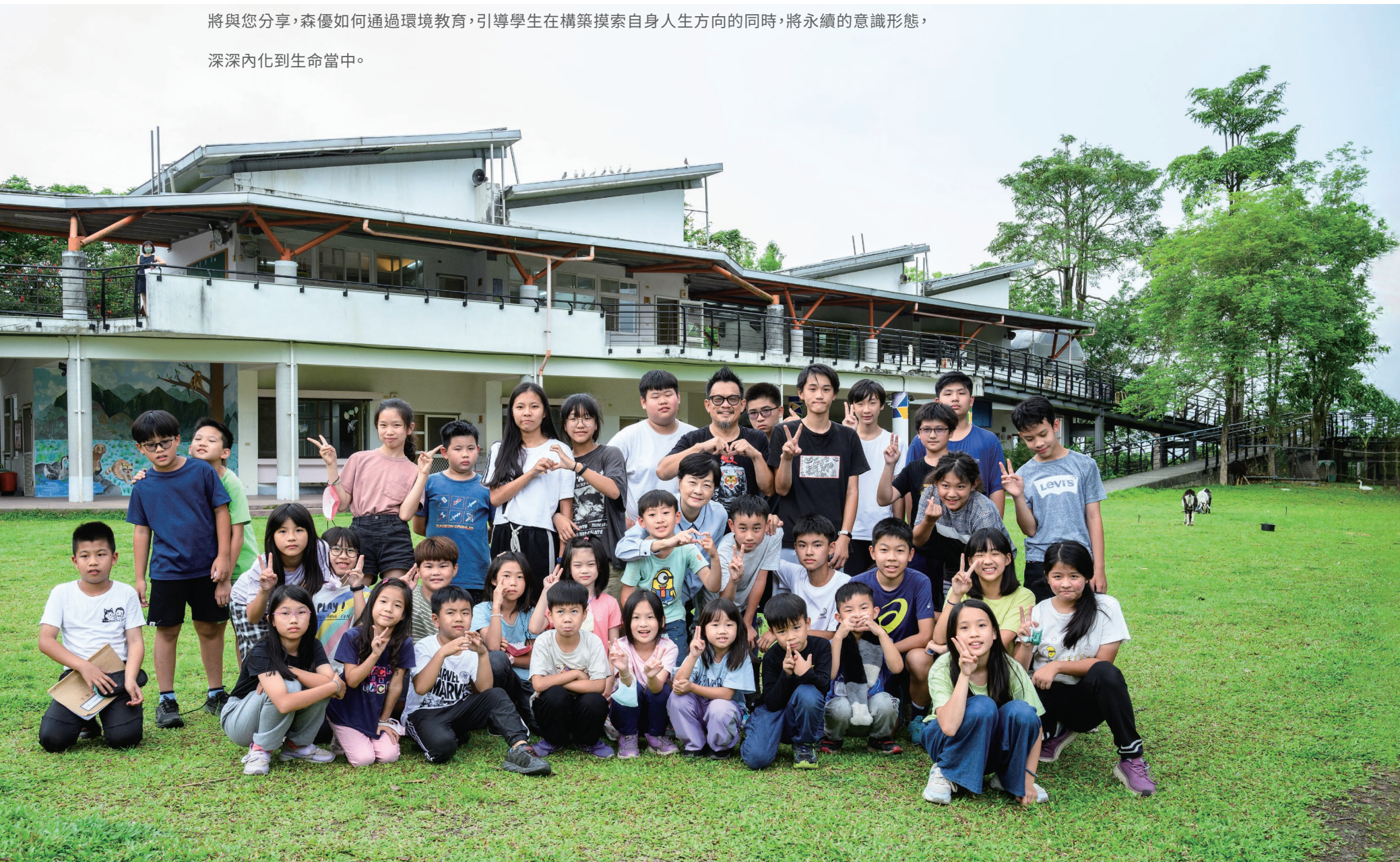
· 偌大的森優校園 是孩子們每天快樂學習的所在

您可曾見過這種光景：將每班只有8人的實驗學校放到廣大的自然校園裡，操場上有羊有雞，每天中午，學生煮自己種植的蔬菜當午餐？這些奇景，是森優生態實驗教育學校的日常。實現永續發展，已成為當前全球性的浪潮，森優相信，讓學生們更好地認識自然、愛護自然，能夠建立一個更加美好的未來。本文將與您分享，森優如何通過環境教育，引導學生在構築摸索自身人生方向的同時，將永續的意識形態，深深內化到生命當中。