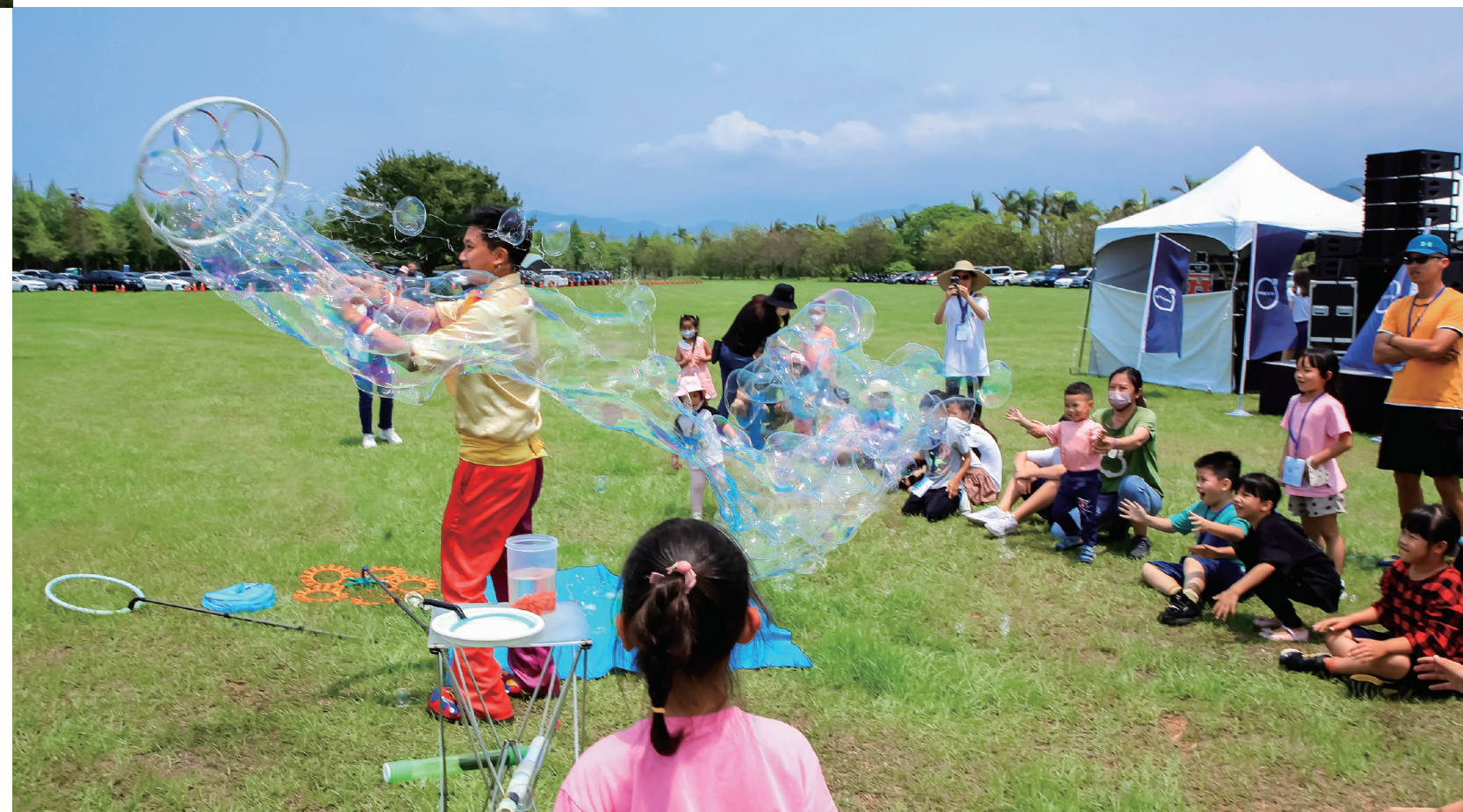
· 繽紛奇幻的泡泡秀 緊緊抓住孩子們的心

草皮上，一顆棒球在空中畫出漂亮的弧線。這是一位爸爸，專程帶來棒球手套和棒球，與兒子玩著拋接球，也同時與VOLVO打造出美好的綠色場景。車主對活動的享受與投入，是對我們最好的回饋，正因為有車主們的全心參與，我們才能共同完成這場充滿綠色永續與循環經濟的難得體驗。VKC家庭日，我們下次再會。