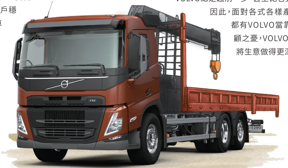
· FM62R420加裝吊桿 不需多花移位費用(此為模擬圖，依實際車輛規格為主)

國家法規會隨時間演變有所不同。然而在對應法規上，VOLVO總是超前一步，甚至比它更加嚴謹。因此，面對各式各樣產業，鉅翔都有VOLVO當靠山。無後顧之憂，VOLVO幫助鉅翔將生意做得更深、更廣。