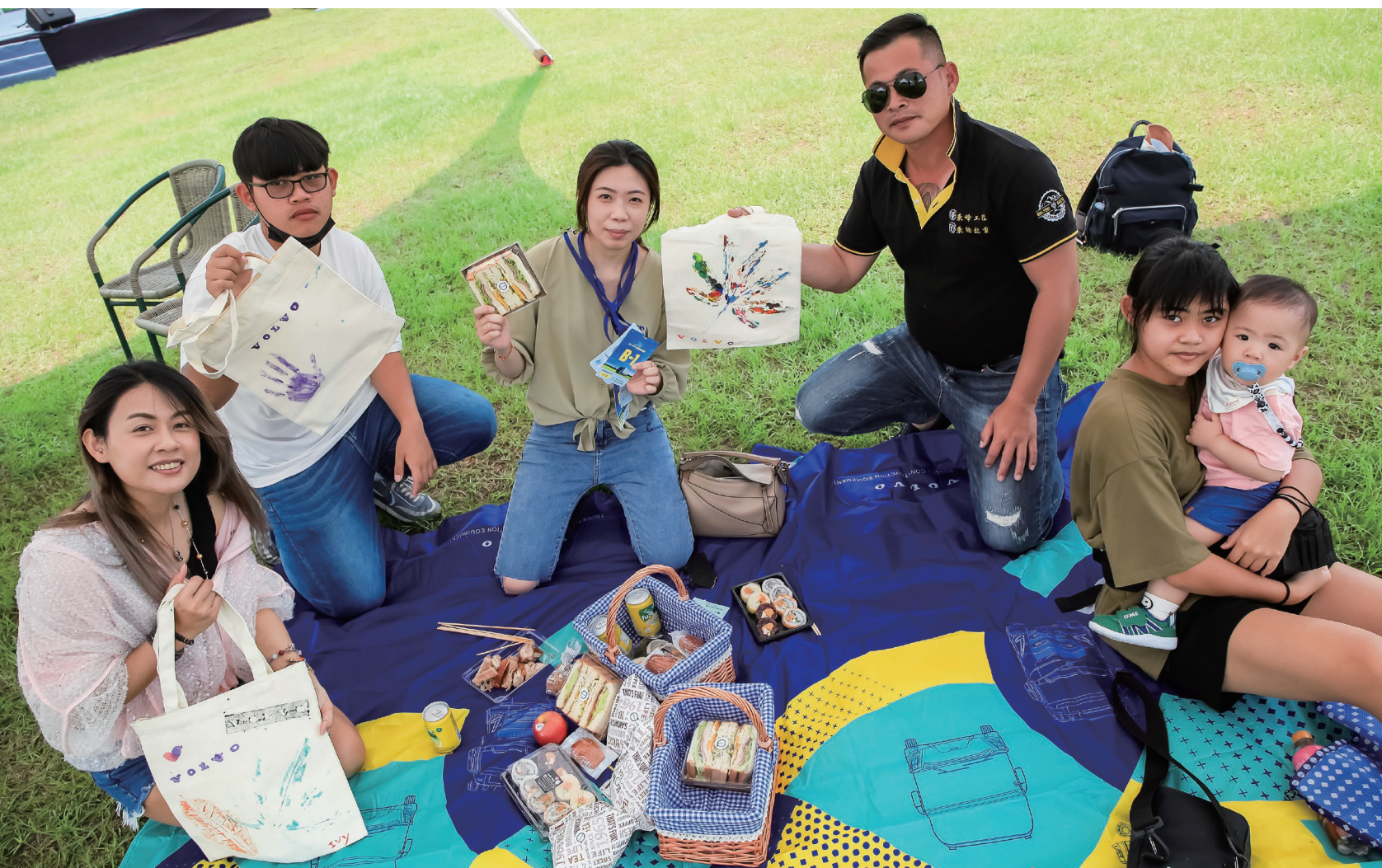
· 團家大小一同享受愜意的野餐

2023 VKC家庭日，VOLVO將麗寶樂園的落羽松草原，化作一場大型的野餐派對， 與所有的車主一同，在派對中自然感受綠色生活。