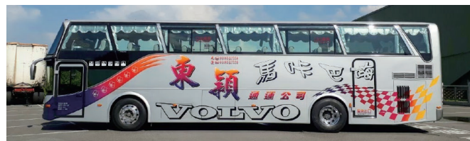
· 車體寫著「馬味巴嗨」代表阿美族語最高等級的讚美

「到夏威夷要說『阿囉哈！』、到泰國要說『沙哇蒂卡！』、而當你到花東，就要說『馬味巴嗨！』。『馬味巴嗨』是阿美族的讚美語，阿美族裡沒有第一名、第二名，只有最好的，也是最美麗、最熱情、最能表現讚美對方的話。我們公司的旅遊巴士開到任何地方，如果有朋友對我們車身上的『馬味巴嗨』大聲打招呼，那一定是阿美族的。」