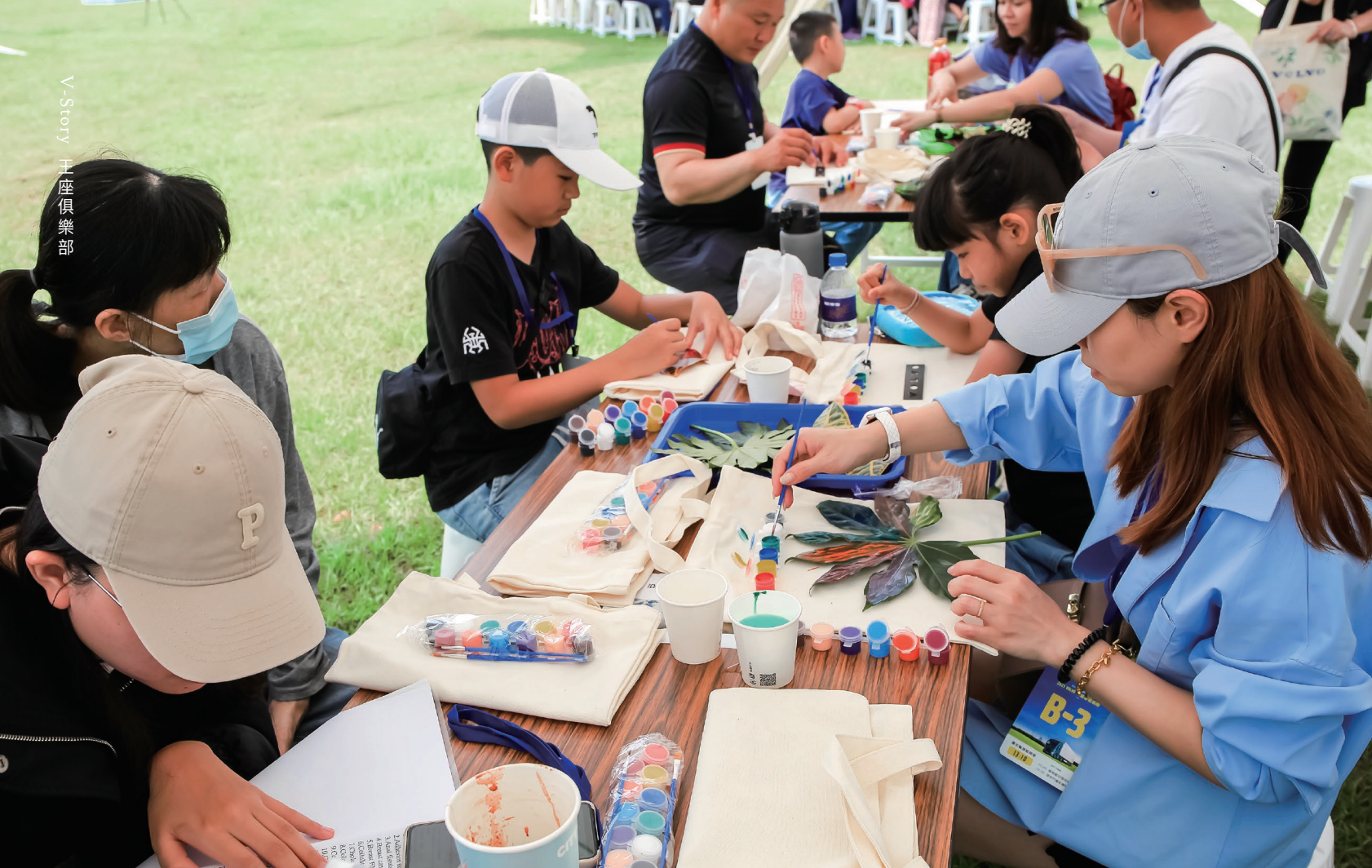
· 透過環保永續DIY 從創意中體會永續意義