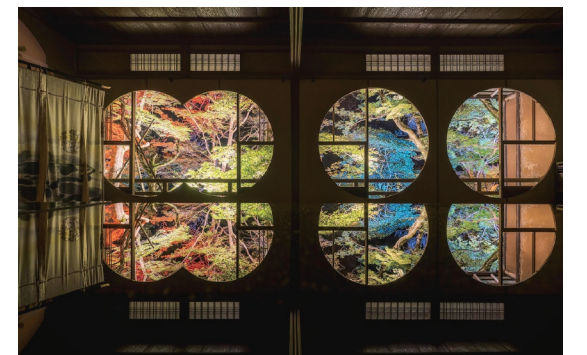
· 傳聞中文豪川端康成下榻的祐齋亭，展現四時景色之美 @wasabitoool