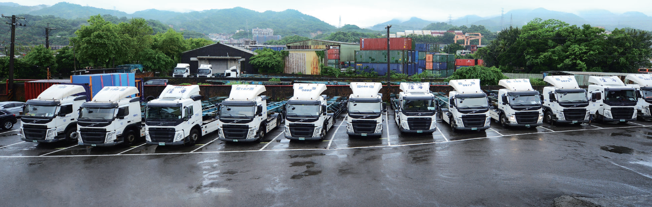
· 提供最高規格的車輛 展現出陸海對員工的重視