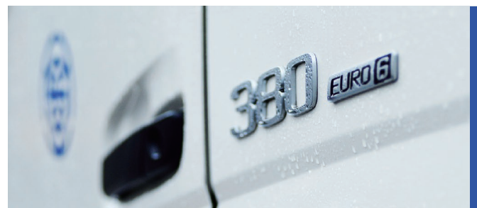
· 歐六 FM 380 是陸海可靠堅實的夥伴

從何董的回顧中，我們清楚感受到，面對疫情，除了打鐵還須自身硬的本業核心能耐之外，與同業間的互動，尋找如何在競爭與合作的天秤兩端、找到游移的最佳位置，是一種同行競合間的藝術，詮釋得好，與同業的關係就能從競爭對手變為革命夥伴。事實上，陸海在經營與同業間的關係，長久以來一直是主動尋求良性合作，彼此互相支援、減少運力閒置、提高運能使用率來共榮共利優化生存路徑。而這場疫情，剛好驗證了陸海的經營方向，一直是在正確的道路上。