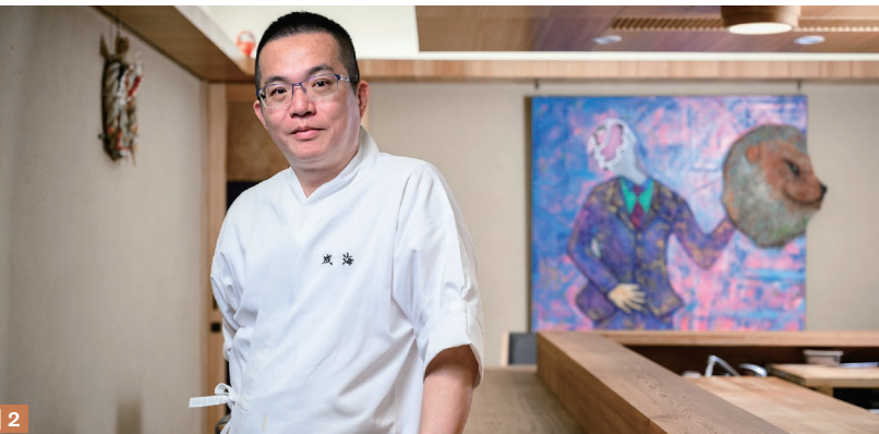
1 在地食材的絕妙安排 令人拍案叫絕 | 2 溫馨的店面裡 款待的心意無窮盡