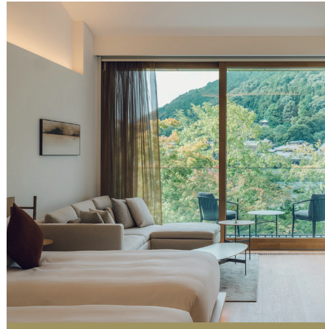
· 旅館內的空氣同樣靜謐澄明

僅僅透過一扇窗戶，便可以俯瞰豐富的自然美景和幽靜花園——根據季節和時間改變風貌，這些向大自然借來的風景，是來自嵐山的禮物。位於風光明媚的嵐山山腳下，渡月橋前，MUNI KYOTO於2020年8月全新開業，為遊客提供了獨特的日本傳統和現代文化融合體驗。