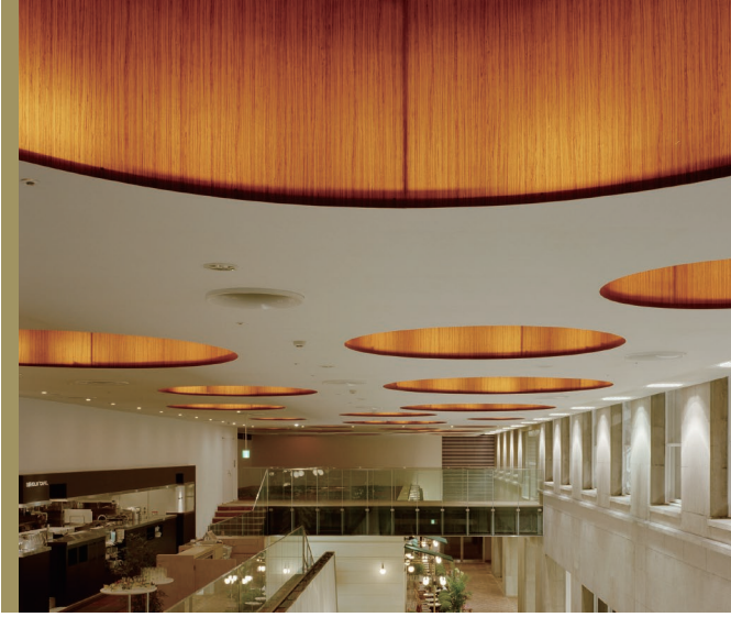
· 原木質地增添自然元素，讓來客更容易放鬆心情