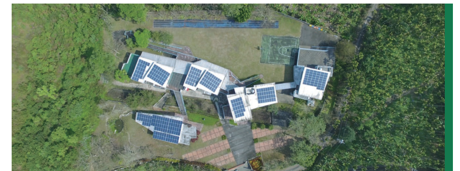
· 被山林環繞的森優 有許多與大自然接觸的機會

蔬菜要防蟲怎麼辦？孩子們為蔬菜噴灑小蘇打或是洗碗精與葵花油混和而成的葵無露，在蔬菜周圍種植具備天然防蟲效果的芸香，讓大自然來幫忙。