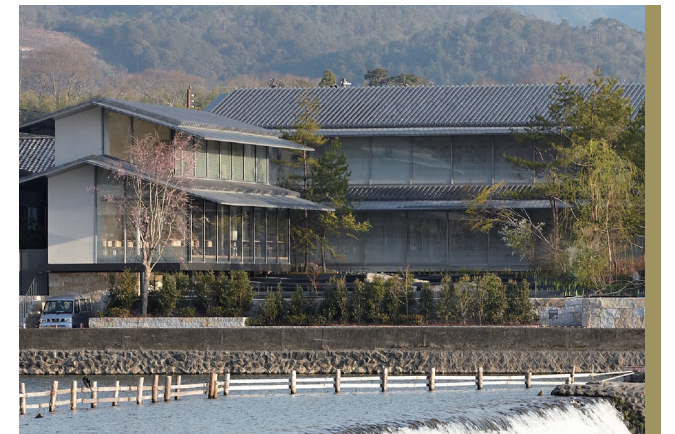
· 鮮少高樓大廈，嵐山的自然古樸之美，仰賴眾人的共識得以保存

聽江水的靜謐，看月光灑過橋墩，晨露隨風飄香……。只有親自到訪該地，才能獲得的無可取代的體會。MUNI KYOTO擁有這樣獨一無二的風景，也以這份獨特性做為旅館的基調，MUNI KYOTO，為嵐山的歷史增添新的色彩。