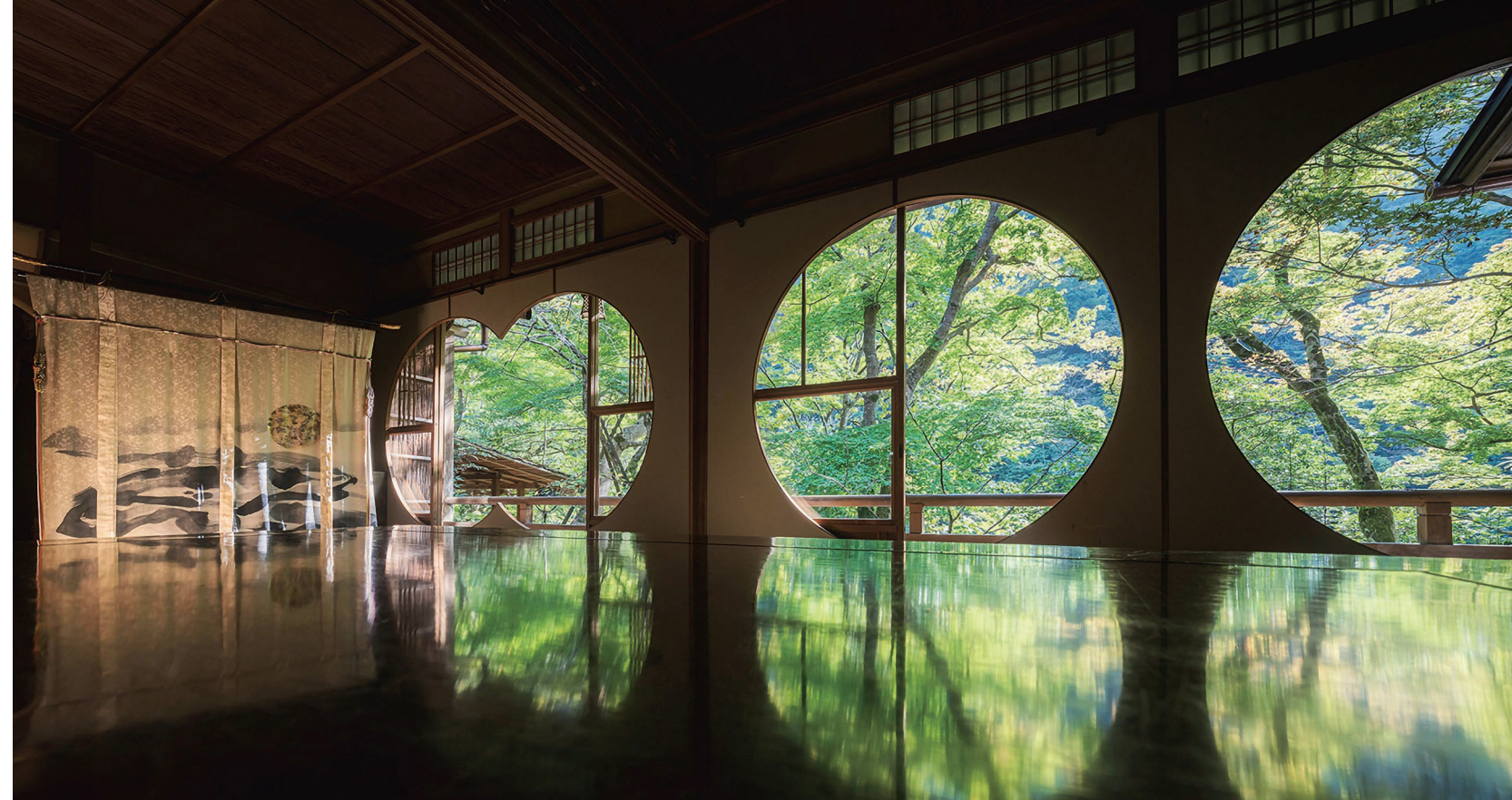
· 透過窗景，同時品味桂川流水與嵐山綠蔭 @wasabitoool