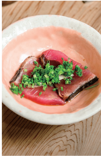
· 來自愛媛縣的萬能蔥與鯉魚