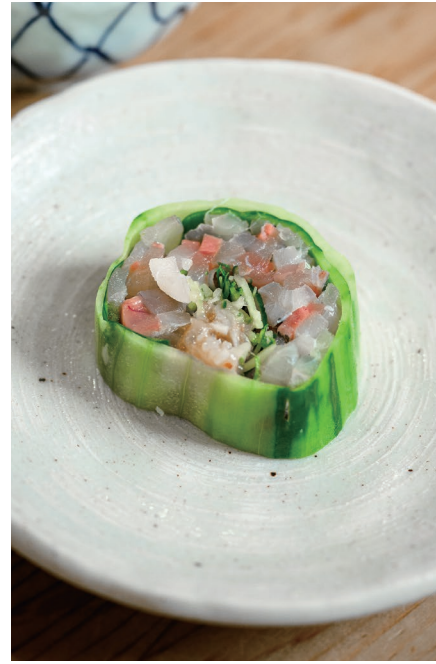
· 小黃瓜取代海苔 包覆海魚及增添口感的雞軟骨