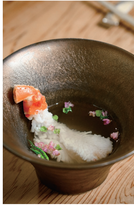
· 浸於淡雅高湯中的蟹腳