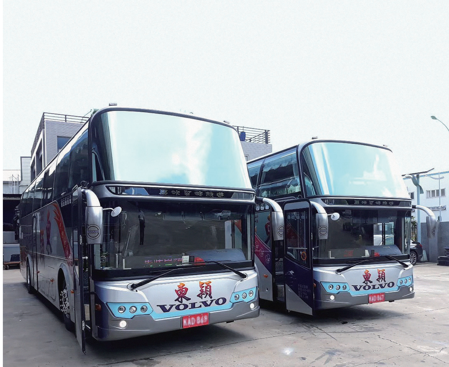
· VOLVO巴士與東穎 一起帶客人暢遊花東

謝董說，當疫情剛開始蔓延、讓大家不知道盡頭在哪時，未知的徬徨是他們最大的恐懼。剛投資的VOLVO遊覽車，半年跑不到1千公里，他們努力苦撐，盡力維持著公司的完整。那時，謝董跟閻娘討論，停損點必須設下，但該設在哪裡？閻娘認為2年、謝董想再4年，最後協議，如果曙光始終未現，再撐三年。