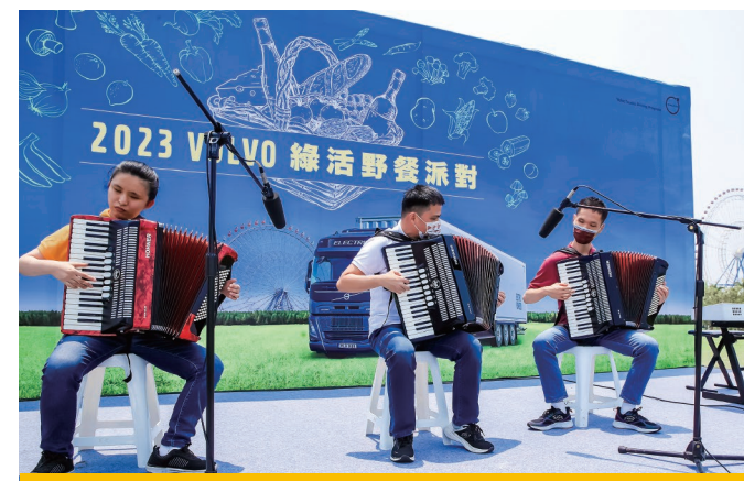
· 打破身體障礙 惠明樂團帶來悠揚樂音

最後，在滿天泡泡飛舞當中，巨大的泡泡帶著眾人一起進入奇幻世界，不只小朋友沉浸歡樂氛圍，連大人都忍不住靠近，臉上淺淺的微笑，是回到童趣的放鬆笑容。原本只會一個勁飛撲向空中泡泡的孩子們，在專業的「泡泡哥哥」引導下，漸漸變得專注，學會欣賞表演的禮儀。泡泡哥哥在小朋友頭上做出冰淇淋，把小女孩變成可愛的小兔子，更用超~巨大