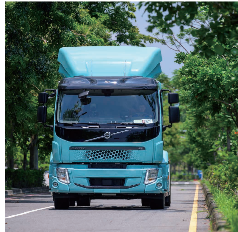
· VOLVO 對 ESG 的承諾 促成美好合作

「ESG 原則對我來說非常重要。它制定了一套原則，供全球所有人遵循，用來衡量他們的表現，確保所提供的技術和