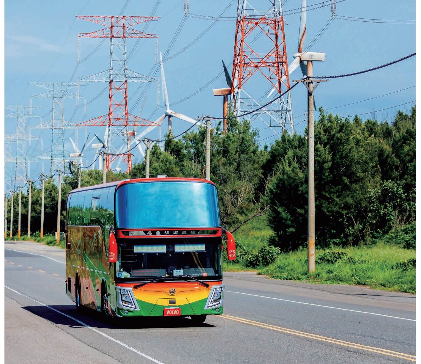
· NEW B8R是幫助企業更繁榮的堅實夥伴