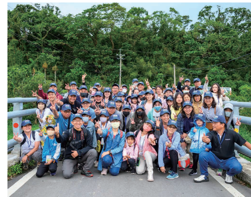
· 在富里豐南村 闔家體會當地文化之美

導覽回程中，大家一路用雙腳在山間行走，耳邊伴隨五晶老師的歌聲，雙手則是歡快地打著拍子。到導覽尾聲，大家不約而同的向解說老師道謝。一聲聲的「Aray」此起彼落，城市與農村的距離，在此時更加靠近了一點。