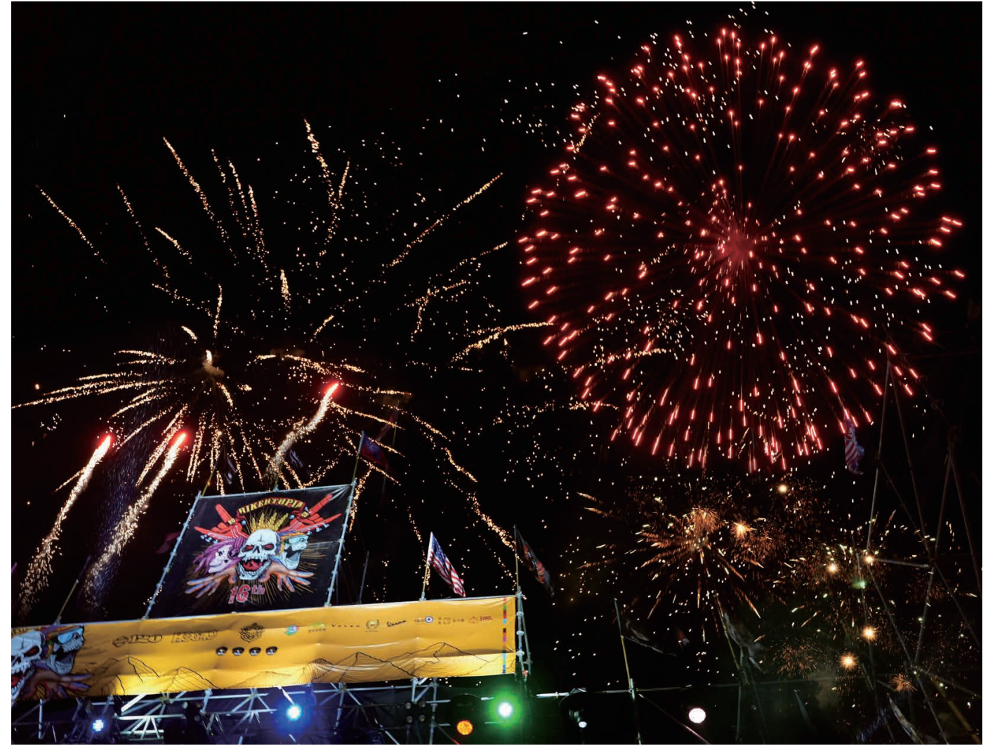
· 盛大煙火 照亮太古與地方共同創生的熱情

對於太古集團在富里鄉實行的創生計畫，富里鄉鄉長認為，這是因為彼此理念相同，這份永續共榮的心意，不謀而合。此時，在場的富里鄉鄉親，將一盞盞放入燈光的玻璃瓶送到每一張餐桌上，藉此感謝哈雷去年在富里鄉颶風急難時第一個來救助，以及這些年的友好往來。「你們就是我們的家人，歡迎回家。」溫暖的燈光流瀉一桌，許多車主小心翼翼將瓶燈捧起，一如他們呵護、關照富里鄉的鐵漢柔情。