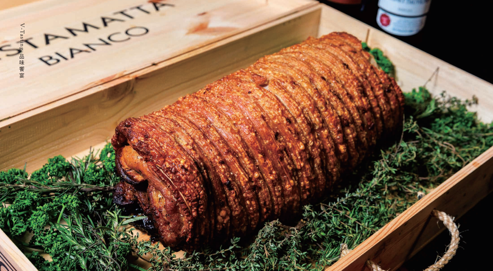
· 使用台灣豬的香草豬肉捲 外酥裡嫩