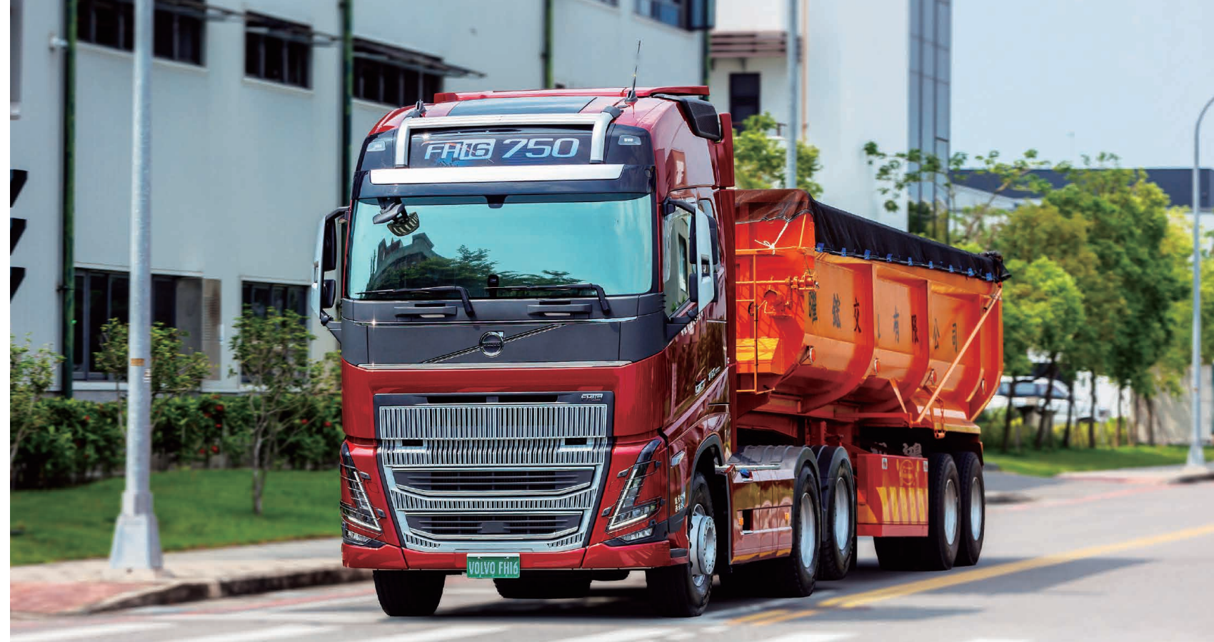
· 強大馬力 將競爭對手拋在腦後

聽懂了，不論客戶是公家機關、還是民間企業，都有不同的利潤結構，客戶性質多元化，代表的就是風險分散，利潤也更多元。