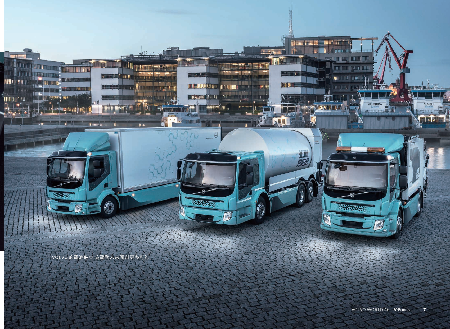
· VOLVO的電池進步 為電動未來開創更多可能

VOLVO Trucks的電動革命已經展開，新的電池技術將繼續推動這一變革，帶來更加環保、高效的都市運輸解決方案。