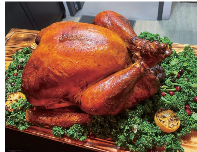
· 上圖 / 台灣綠竹筍搭配沙巴雍醬汁 融合在地與異國