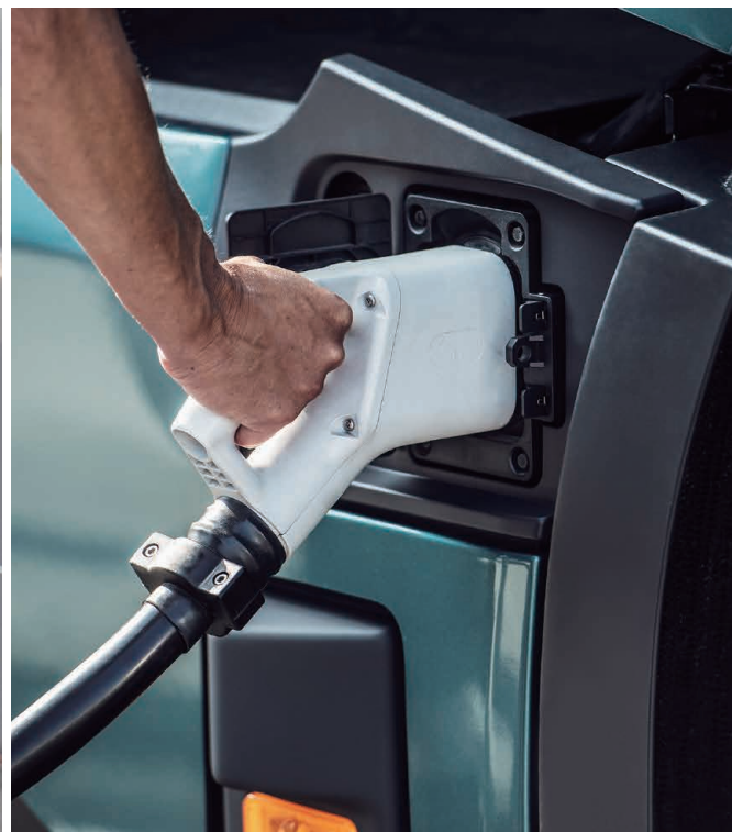
· 嶄新的電池技術 容量更大 充電更快