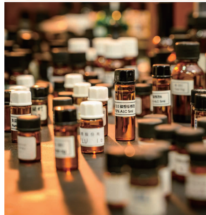
· 上圖 / 拿下香水界至高榮譽 讓世界看見台灣 下圖 / 運用諸多氣味 構築出文化的樣貌